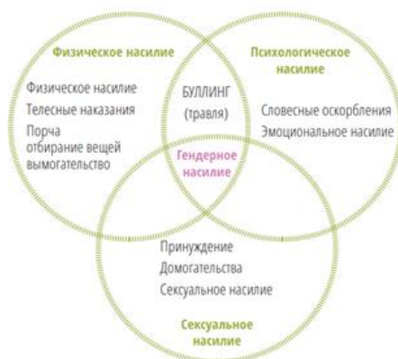
Рисунок 1. Виды насилия

Физическое и психологическое насилие часто начинается с запугивания – угроз в устной или письменной форме (в том числе с использованием электронной почты, социальных сетей), физических нападков и других действий с целью внушить страх, подчинить жертву, принудить ее к совершению каких-либо действий. Запугивание основано на реальном или предполагаемом неравенстве сил обидчика и пострадавшего. Если обидчик не получает должного отпора, как правило, он вновь и вновь прибегает к запугиванию – оно становится систематическим.